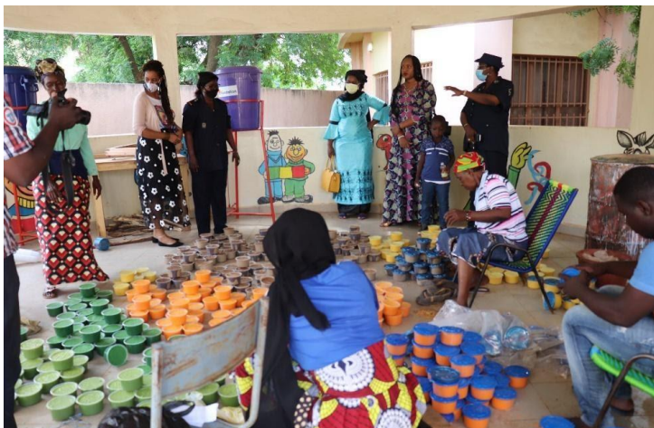
Atelier d'emballage de savon