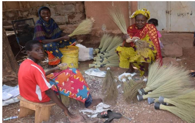
Fabrication de balai par les groupements de femmes