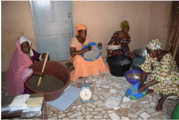
Séance de transformation des céréales