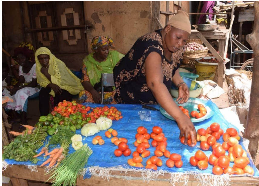
Membre du groupe Dembagnuma au marché de Daoudabougou, quartier pauvre de Bamako