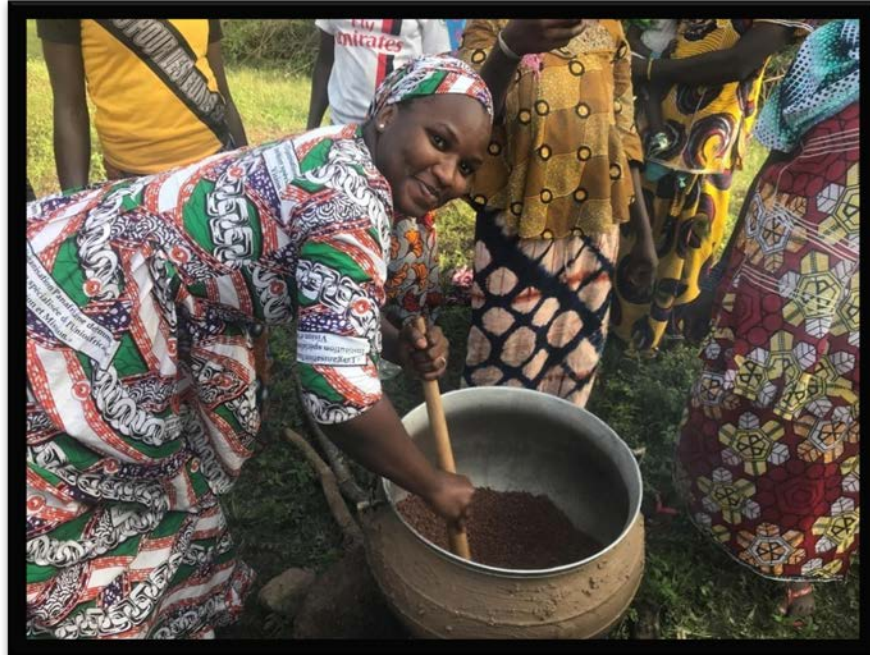
Membre de la coopérative du village de Kaï qui fabrique du beurre de Karité.

Ce sont 18 % des fonds alloués en 2018 qui contribuent au renforcement des organisations et leur permettent d'améliorer leur gestion et leur fonctionnement.