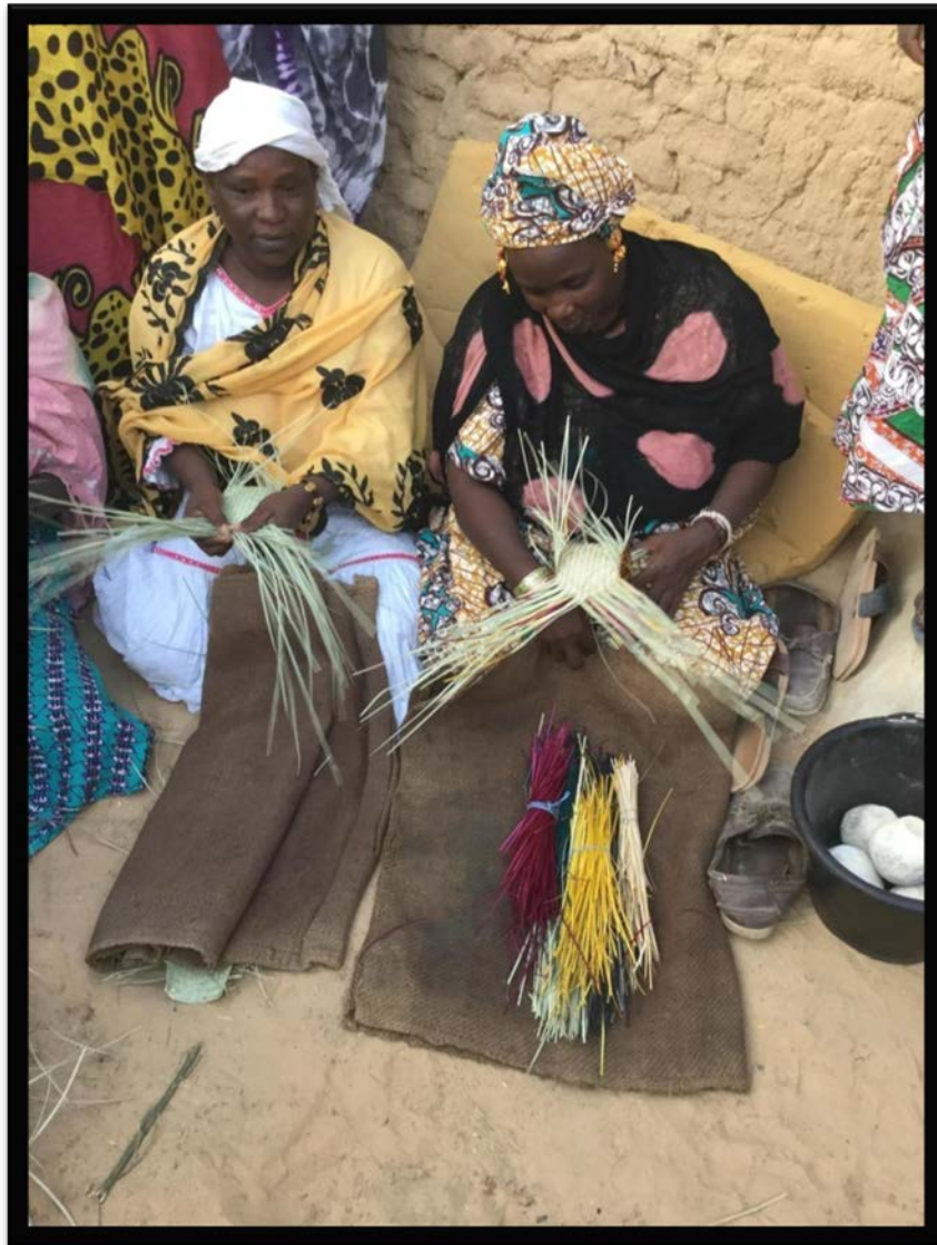
Membres du groupe des artisanes du village d'Iloa près de Tombouctou, au bord du fleuve Niger, fabriquant des nattes en pailles colorées.

Ce sont 90 % des montants recueillis qui sont alloués aux organisations de femmes, 10 % contribuant aux frais de gestion du CECl. Ainsi 233 100 $ , dont 53 100 $ en début 2018, ont été alloués à 25 associations regroupant près de 1190 femmes. Ces associations sont des coopératives et des groupements à statut divers, situées dans les quartiers pauvres de Bamako, dans des régions comme Tombouctou et Kayes au nord du pays ainsi que Sikasso. Elles ont pour objectif d'améliorer les conditions de vie de leurs membres.