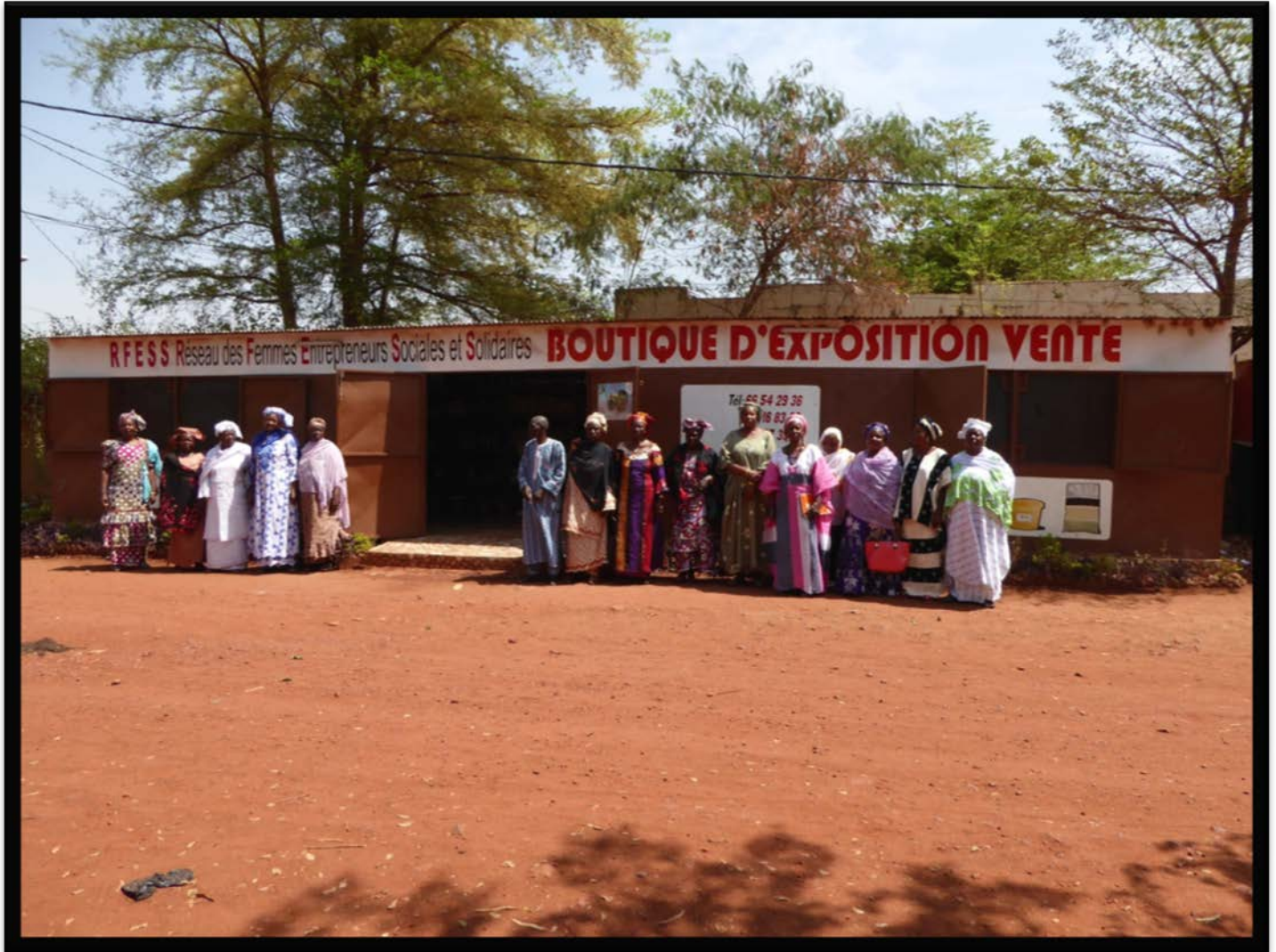
Les membres de la coopérative des femmes d'économie sociale et solidaire devant leur magasin de vente de produits agroalimentaires transformés.