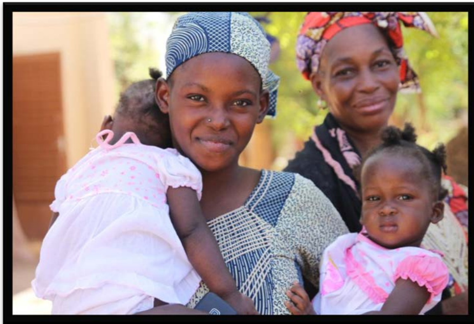
Les femmes et leurs enfants au centre de santé de Yrimadjo, quartier pauvre de Bamako

Ce bilan a pour objectif d'informer les donateurs et les donatrices du Fonds Armande Bégin du CECI (Centre d'étude et de coopération internationale) sur les montants recueillis, l'allocation des fonds et les résultats obtenus en 2017.