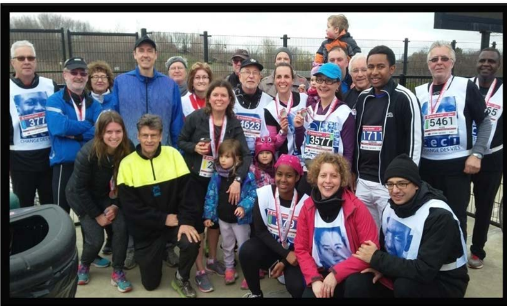
Photo 1. Une partie des participant-e-s au Défi caritatif de la banque Scotia en 2017

Plusieurs activités de collecte de fonds sont organisées par la famille et les ami-e-s d'Armande. Le CECI participe chaque année à la course du Défi caritatif de la Banque Scotia où le Fonds Armande Bégin a sa propre équipe. Les participant-e-s marchent ou courent 5K, 10K ou 21K et sollicitent des dons en argent auprès des membres de leur entourage. En 2017, près de 40 personnes ont participé au défi et on s'attend à une participation en hausse les 21 et 22 avril 2018. Le Fonds a bénéficié aussi de dons in memoriam et d'un don testamentaire.